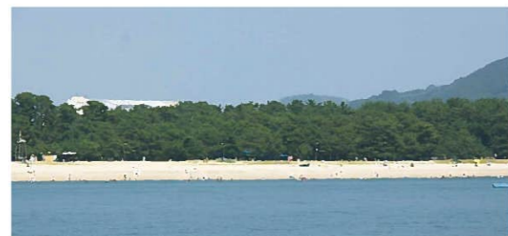
【百選地(渚)】室積・虹ヶ浜海岸