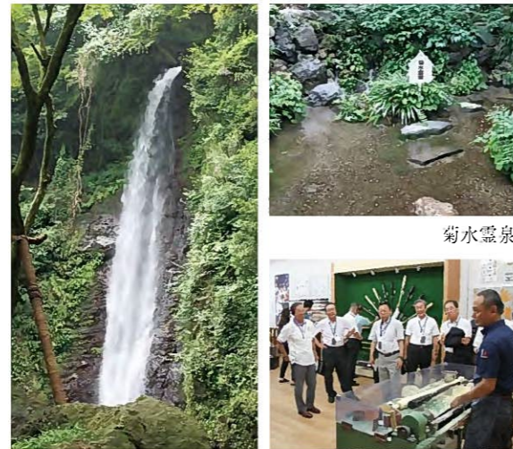
【百選地(滝)】養老の滝 ミズノテクニクス(株)養老工場を視察