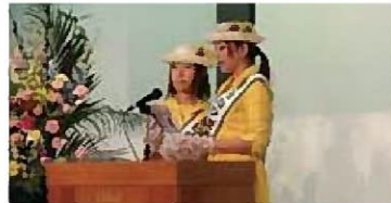
日向宣言 日向ひまわりレディ