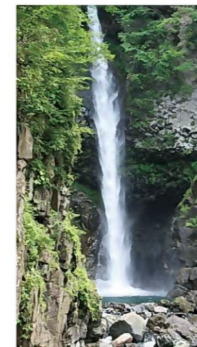
【百選地(滝)】根尾の滝