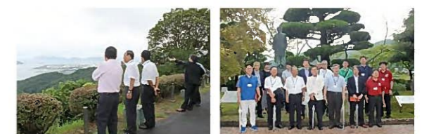
「萩の平展望台」から海岸沿いを臨む