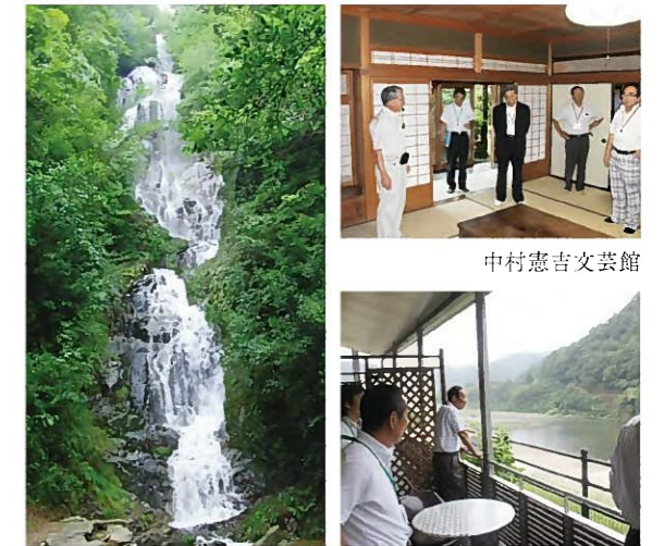
【百選地(滝)】常清流 カヌー公園さくぎから望む江の川