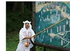
【百選地(森)】 羽黒山・参道の並木道