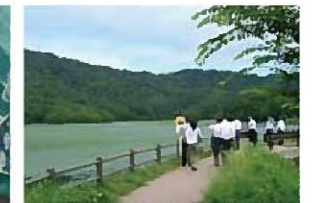
【百選地(森)】 高館山自然休養林