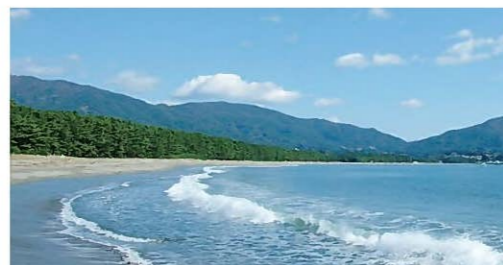
震災前の高田松原

2017年5月27日、岩手県陸前高田市の百選地「高田松原」で開催された「高田松原再生記念植樹会」では、2014年度以降、会員4団体(宮城県蔵王町、千葉県鴨川市、千葉県横芝光町、山口県光市)で育苗してきた松苗200本の植樹を行いました。