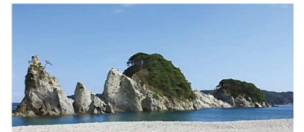
【百選地(渚)】浄土ヶ浜