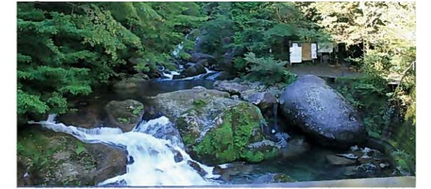
【百選地(森)】屋久島自然休養林／白谷川