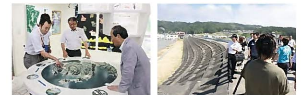
浄土ヶ浜ビジターセンター 田老地区に建設中の防潮堤