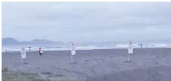
【百選地(渚)】お倉ヶ浜