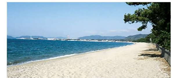
【百選地(渚)】室積海岸