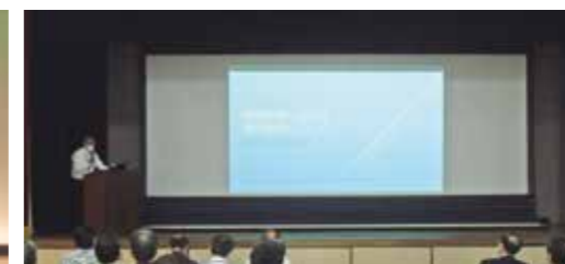
事例発表(滝) 茨城県大子町