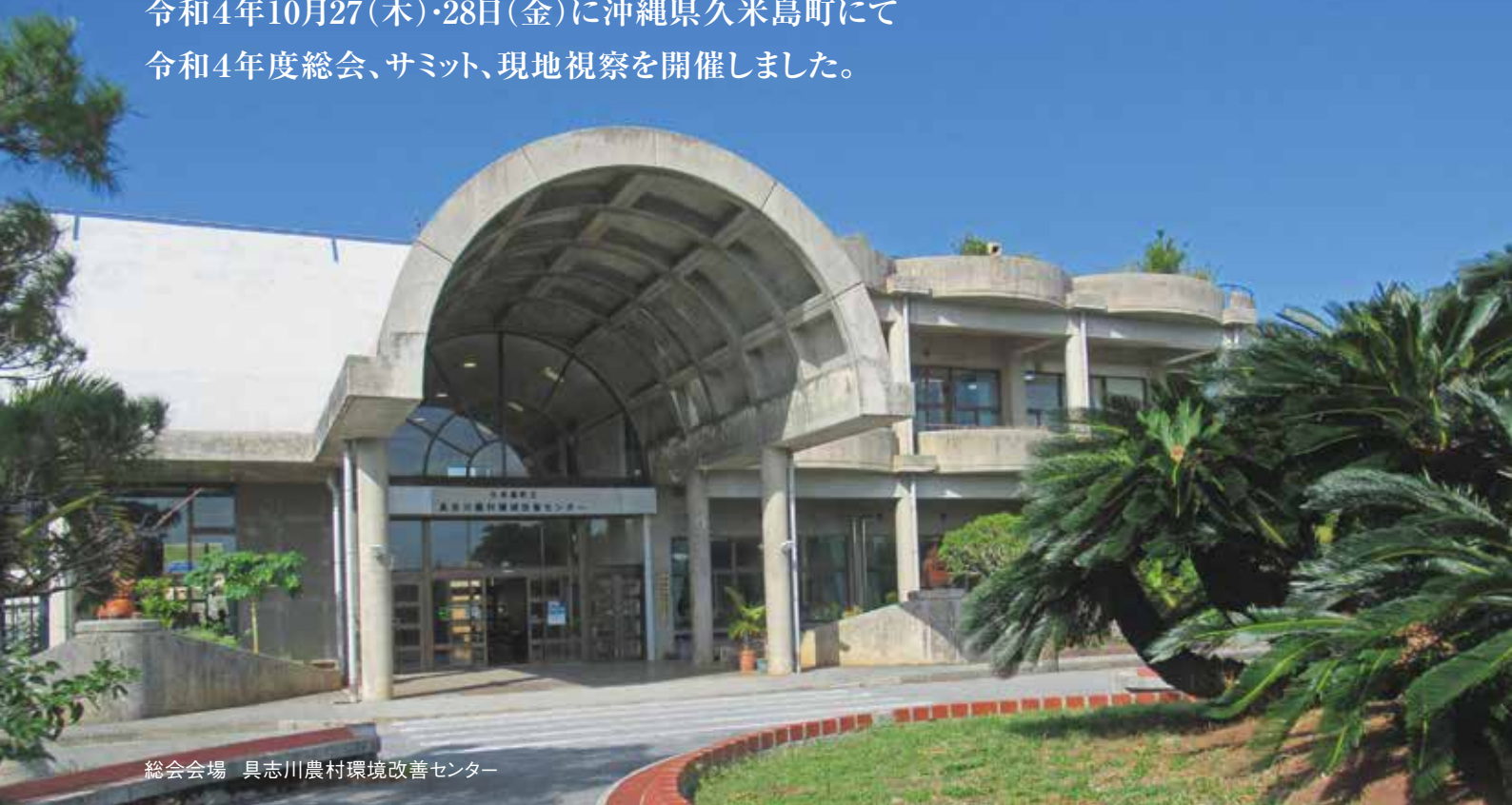
総会会場 具志川農村環境改善センター

令和4年10月27(木)・28日(金)に沖縄県久米島町にて 令和4年度総会、サミット、現地視察を開催しました。