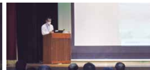
事例発表(森) 茨城県大子町