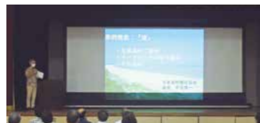
事例発表(渚) 久米島町観光協会

然と共に生きる地域の振興と発展を目指すことを誓う「久米島宣言」を唱和し、閉会しました。