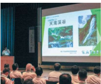
事例発表(森) 兵庫県養父市