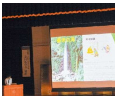
事例発表(滝) 岐阜県養老町