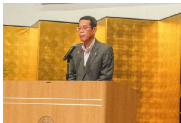
長戸町長あいさつ