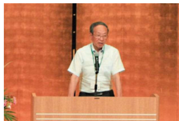
市川会長あいさつ