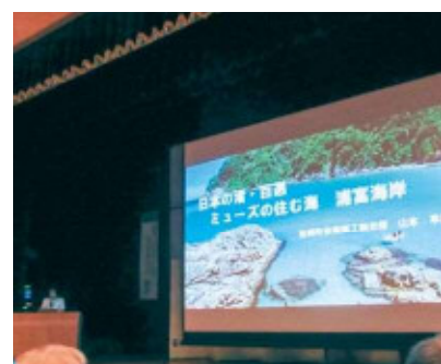
事例発表(渚) 鳥取県岩美町

「森」部門の事例発表では、兵庫県養父市から「天滝渓谷」について、養父市の紹介とともに、渓谷の入り口から渓谷沿いに整備さ