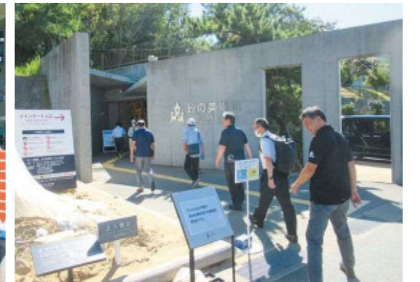
鳥取砂丘 砂の美術館