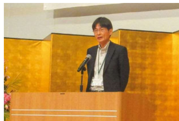
番匠課長あいさつ